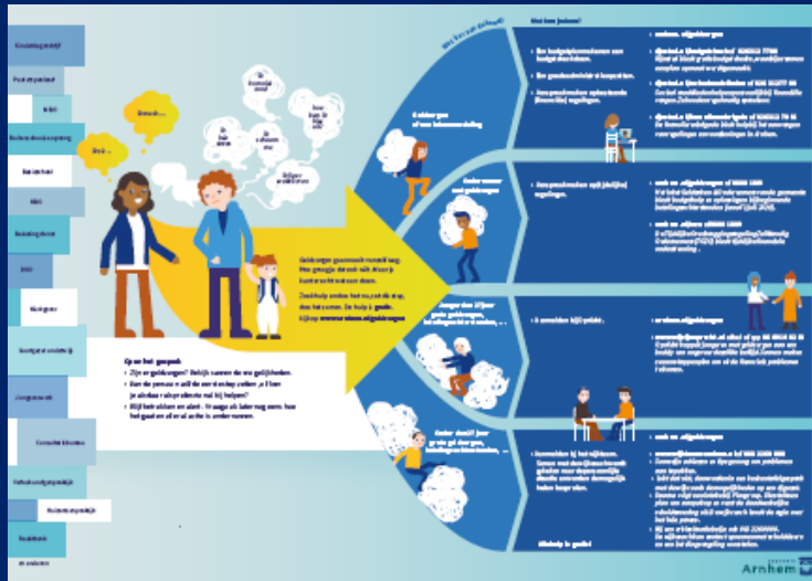
Routekaart Flyer inwoner